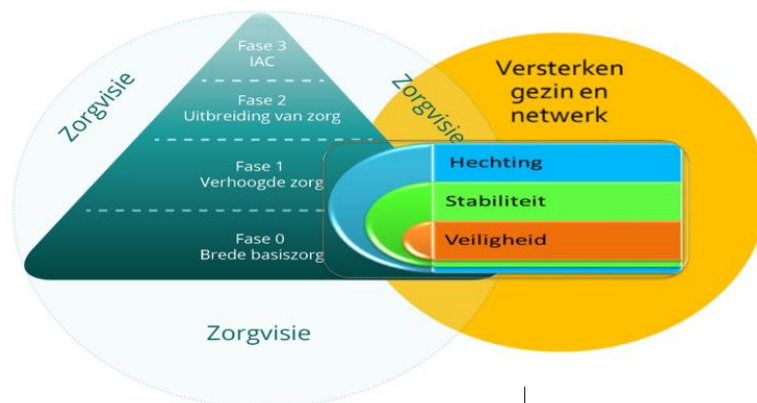
Figuur 2: Traumasensitieve zorg in het zorgcontinuüm.

Ook als het gaat om leerlingen met een vluchtverhaal biedt het zorgcontinuüm een kader waarbinnen de leerkracht en de school samen met het CLB de zorg voor deze leerlingen kunnen opnemen (Figuur 2).